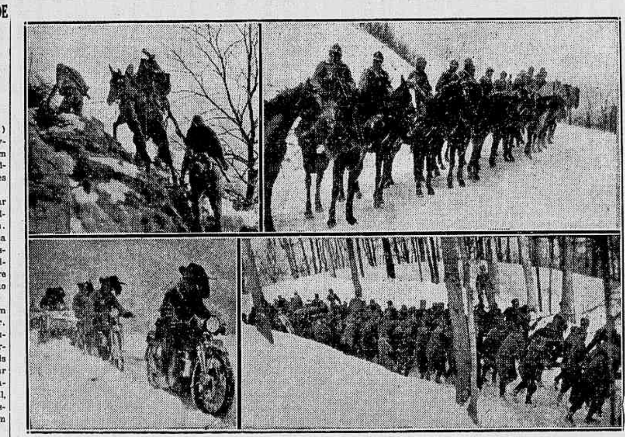
AS ULTIMAS MANOBRAS DO EXERCITO ITALIANO — Aspectos das manobras de inverno realizadas pelo exercito italiano no mez passado, com varios desenvolvimentos em zonas de topographia montanhosa e difficil, que illustraram todas as modalidades de acção ardua e severa

Varsovia, 27 (A. B.) — O conde Petasicki acaba de ser nomeado ministro da Polonia em Roma. O novo representante polonês deverá partir imediatamente para assumir o seu posto.